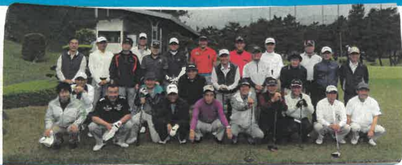
全員集合 ハイチーズ♡

こんにちは。😊 3月末から、 筑紫駅前支店でお世話になってます。 社会人としての心構えを持ち、 元気いっぱい頑張りますので、 よろしくお願いいたします!