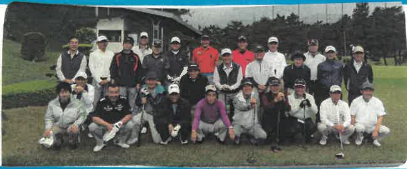
全員集合 のハイチーズ♡

こんにちは。😊 3月末から、 筑紫駅前支店でお世話になってます。 社会人としての心構えを持ち、 元気いっぱい頑張りますので、 よろしくお願いいたします!