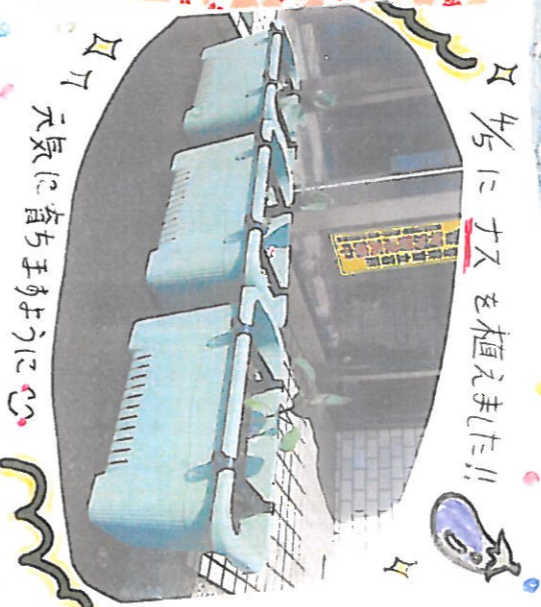
JA 蛸塚 榎寺出張所 TEL 092-925-2956

その他のお知らせ H28 4/1 ~ 5/1 サブ-定期 * 振替口座振替口座に振り込み可。 H28 4/1 ~ 4/31 食の恵み (定期積金) 詳しくは窓口まで お電話ください。