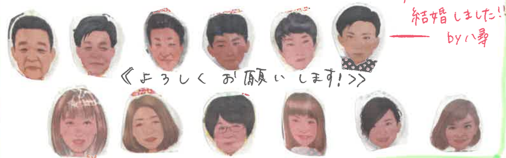
実は... 結婚しました!! by 八尋

支店入り口右側のウェルカムボードで職員ひとりひとりの紹介を しています。おまじり見られたことのない方はぜひ見とみて下さい(^^)/ すごくいい特徴づかんできていますね。