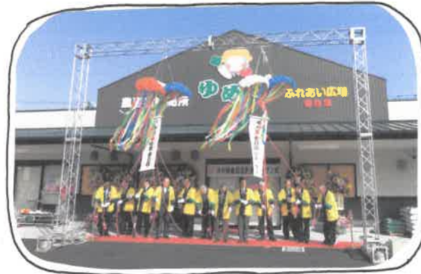
↑ オープンセレモニーの様子

3月23日、大土居支店のとなりに、ゆめ畑春日店がオープンしました! 当日はオープンセレモニーが行われ、その後のオープニングイベントでは、たくさんの方々にご来店頂き大に喜ばれていました!